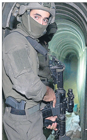
En los túneles de Hamás.