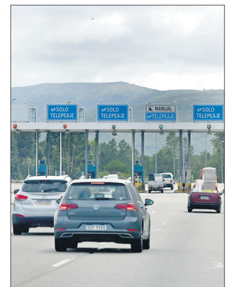
Infracciones en las rutas.