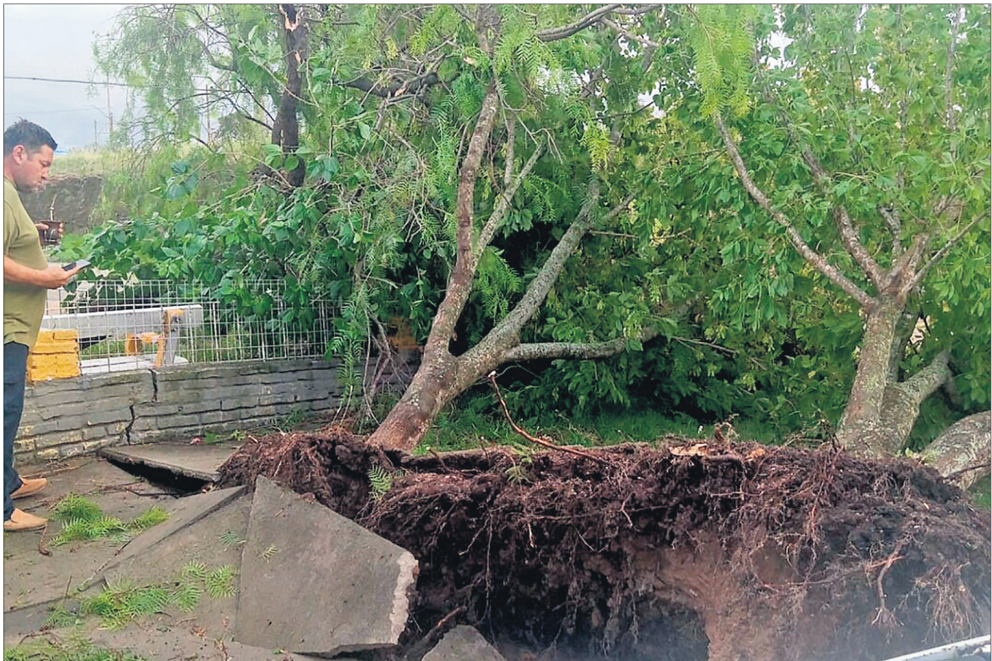
CECOED RÍO NEGRO

▶ CIENTOS DE EVACUADOS: EN CINCO DÍAS SE TRIPLICARON LAS LLUVIAS ESPERADAS PARA UN MES