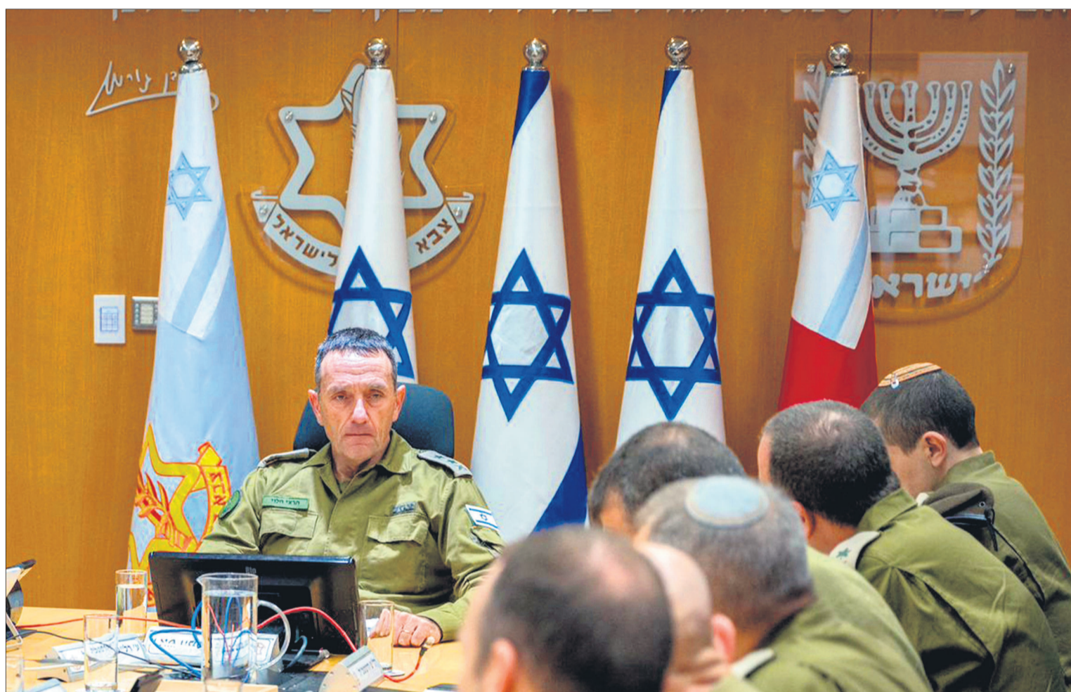
TEL AVIV. El jefe del ejército israelí, el teniente general Herzi Halevi, evalúa la situación con miembros del Estado Mayor en la base militar de Kyria.