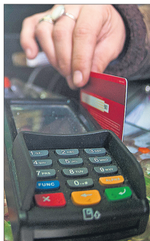
Nuevos resultados sobre pagos.