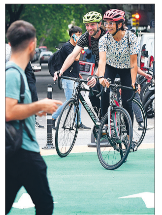
Ciclovía en 18 de Julio.