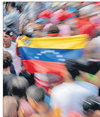
Un pa s golpeado por la crisis.

Ra l Pascal, uruguayo de 61 a os, cree que la poblaci n de Venezuela "perdi  el miedo" y finalmente est  "confiado" en