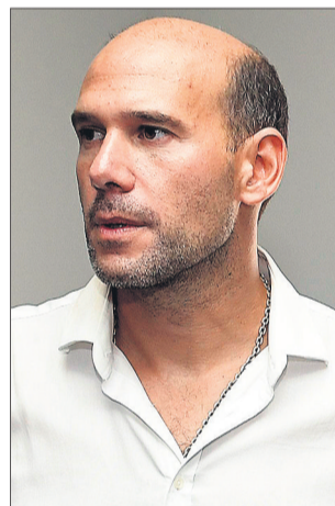
Martín Lema, diputado.

Tras una denuncia realizada contra la IMM por el diputado blanco Martín Lema, la presidenta de UTE, Silvia Emaldi, dijo a El País que de un total de "135 puntos donde se encontró consumo cero de energía" había 13 en donde se confirmó la existencia de "conexiones irregulares". "De esas 13, hay una que se liquidó, ya que la intendencia hizo el pago". Detalló que el monto abonado por la IMM fue de $ 1.197.000. Ahora se espera el pago de otros seis casos, por un total aproximado de cuatro millones de pesos. "Nos quedan 90 puntos para inspeccionar". NACIONAL / A3