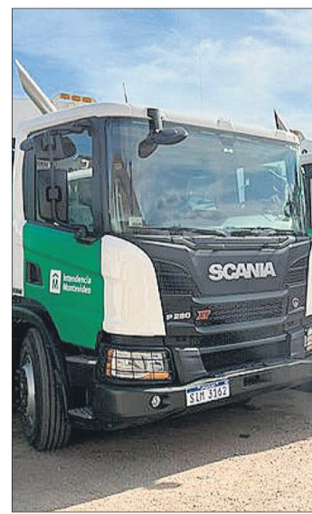
Los nuevos camiones de la IMM.