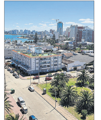
Punta del Este.