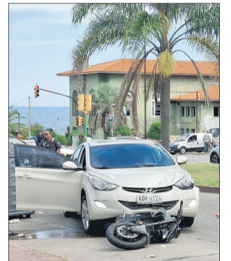
Balacera en la rambla.

Mientras continúa la investigación para encontrar a los responsables del tiroteo a uno de los líderes del grupo "Los Colorados" y su familia en Buceo, un hombre fue asesinado y una mujer herida. Tras el inesperado episodio que se vivió sobre las 15:00 del domingo en la rambla de Buceo, el escenario de la disputa volvió a ser Cerro Norte. Allí viven y se concentran en pocas cuadras dos de las bandas con mayor poder de fuego de Montevideo: Los Suárez y Los Colorados. La víctima fatal fue un hombre de 29 años. En la escena del crimen había más de 30 casquillos de bala. NACIONAL / A4