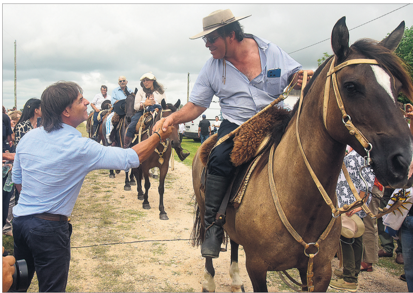
TREINTA Y TRES. El presidente participó ayer de un evento en el que UTE anunció que el 100% de los hogares cuentan con energía eléctrica.