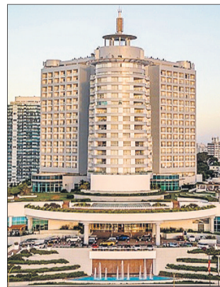
Hotel Enjoy Punta del Este.